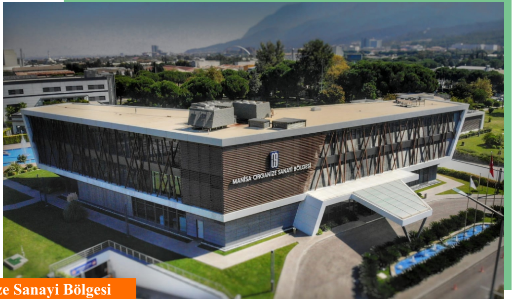
Manisa Organize Sanayi Bölgesi