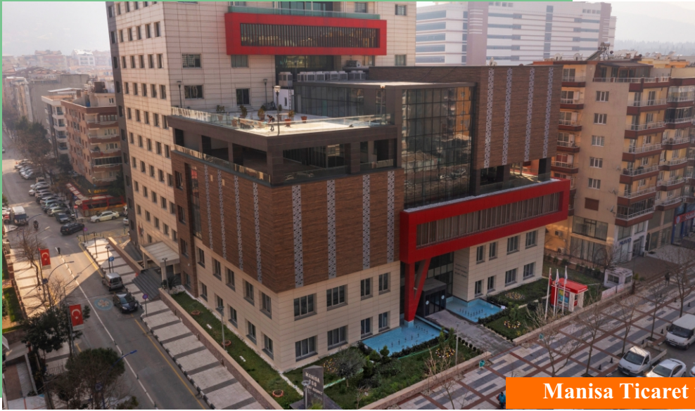
Manisa Ticaret ve Sanayi Odası